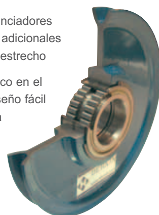
Polea de De Haan Special Equipment B.V. ( www.dehaan-se.com )