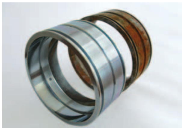
Recubrimiento especial SQ171 con protección contra la corrosión